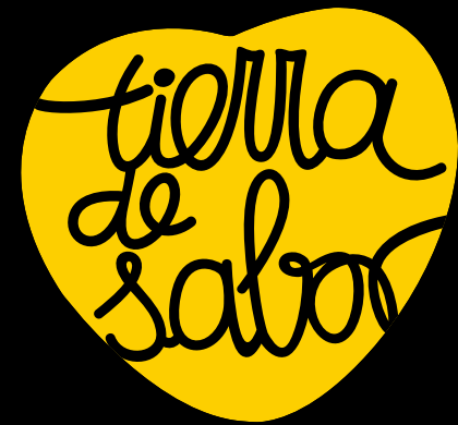
Logotipo blanco y negro