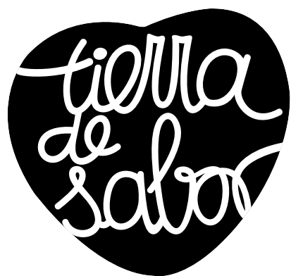
Logotipo "básico" blanco y negro